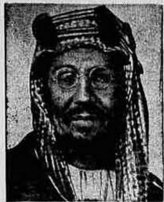
Il Re vittorioso: Ibn Saud.

sercito yemenita prepara l'ultima disperata barriera di difesa. Insignificante è stata la resistenza yemenita financo lungo le gole montagnose nelle vicinanze della capitale.