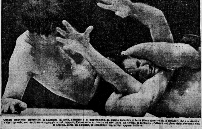
Quattro stupendo: espressioni di elasticità, di forza, d'impeto e di disperazione. In questo incontro di lotta libera americana. Allettatore che è a sinistra e che sfugge, con un braccio appoggiato sul tappeto, l'avversario, è riuscito ad effettuare un colpo di furbata; l'altro è nel pieno della ricossa: alla le braccia, cerca un appiglio, si colpisce, ma ormai appare battuto