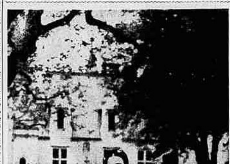
I FIDANZATI DI CANDE' si sono arresi all'assedio dei fotografi che hanno approfittato della vittoria per riprodurre in centinaia di istantanee nel parco della villa.

Cortesie a Ismet pascià. Ismet pascià intento di passaggio per Parigi si è intrattenuto oggi a conferire con Delbos intorno all'accordo franco-turco-siriano sulla sistemazione confinaria della Siria e al problema tuttora pendente del Sangiacato. I membri del governo hanno tenuto a circondare la sosta del Primo Ministro turco di molta cortesia onde dissipare la freddezza rimasta fra i due Paesi in seguito alla confessa sul regime del Sangiacato. Dopo essere stato ricevuto in udienza da Lebrun, Ismet Pascià ha assistito a una colazione in suo onore alla Presidenza del Consiglio con l'intervento di molti ministri, dei presidenti del Senato e della Camera e dell'alto personale del Quai d'Orsay.