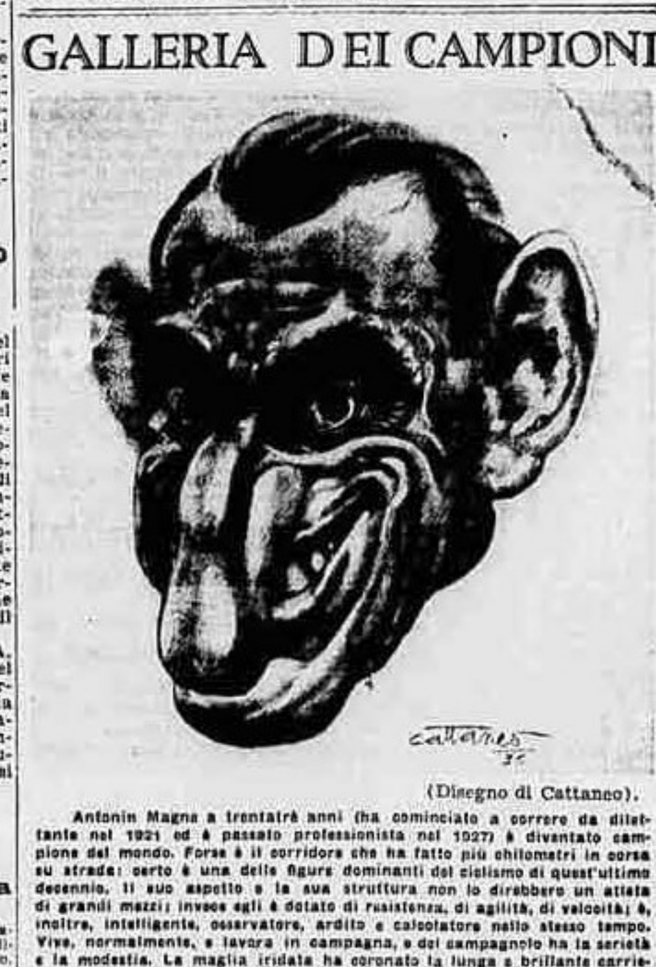
(Disegno di Cattaneo).