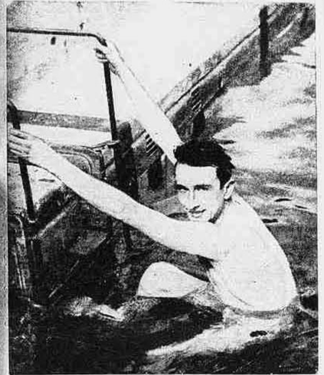
Taris, il fenomenale nuotatore francese