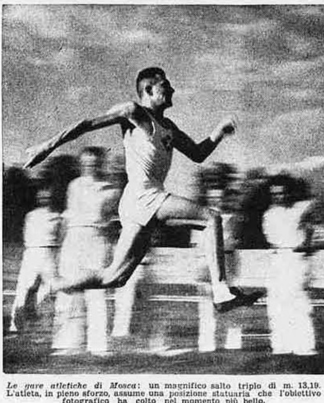
Le gare atletiche di Mosca: un magnifico salto triplo di m. 13,10. L'atleta, in pieno sforzo, assume una posizione statuarica che l'obiettivo fotografico ha colto nel momento più bello...